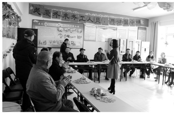
组织外来务工人员一起过大年。