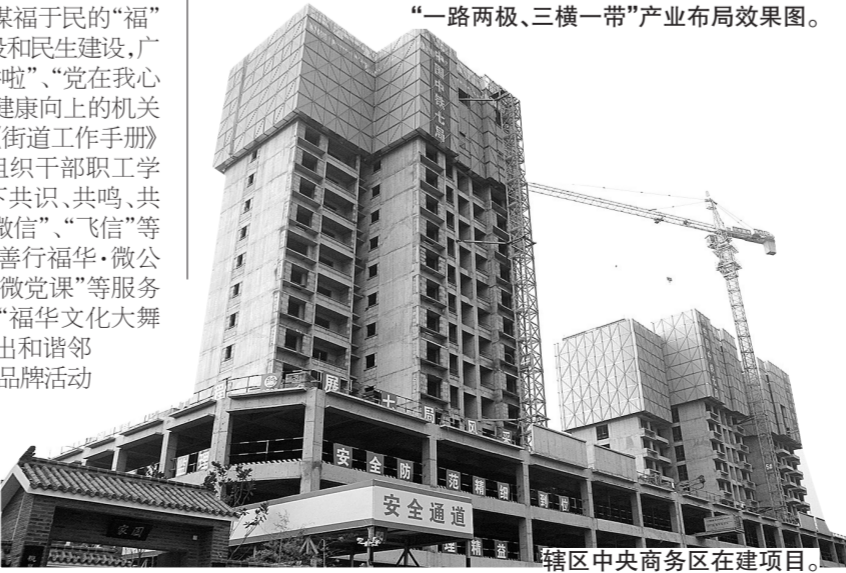
辖区中央商务区在建项目。