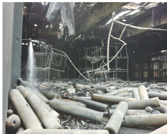
这张美军8月24日提供的照片显示的是美军位于日本神奈川县相模原市军事基地一处破损的建筑内景。

日本官员8月24日说，美军在日本首都东京附近的一处仓库当天凌晨发生爆炸，引发大火，但没有接到人员伤亡的报告。