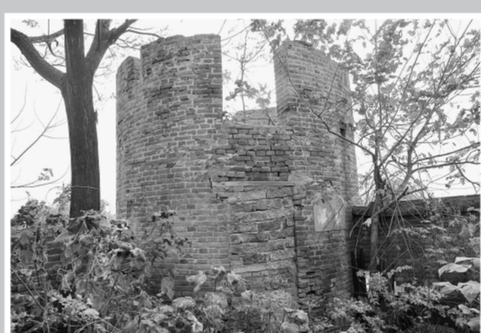
邵岗集炮楼西北侧开口现已被封堵