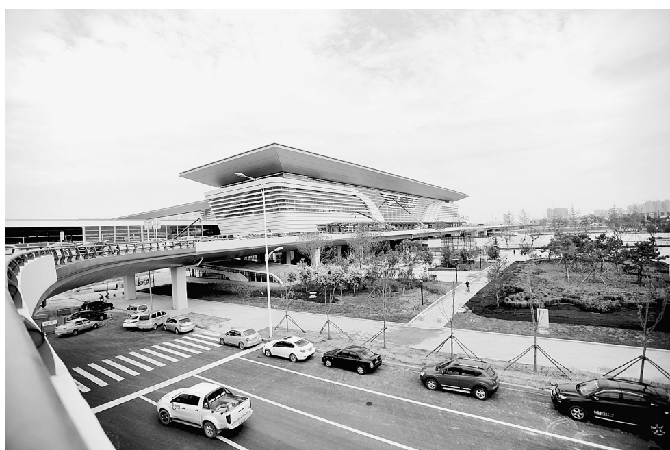
目前,东北地区最大的火车站沈阳南站工程进入收尾施工阶段,整个工程计划年底竣工。今年8月底,沈阳南站的东进站房等部分设施将与沈(阳)丹(东)高铁开通同步启用。这是8月25日拍摄的沈阳南站东进站房外景。

下一步,将继续推动完善金融消费权益保护法律制度框架;提高金融消费者教育的有效性,引导金融机构建立集中性与日常性相结合的金融消费者教育长效机制;推进金融消费权益保护信息管理系统建设;健全金融消费权益保护监督检查工作机制;继续推进普惠金融指标体系研究,开展普惠金融试点。