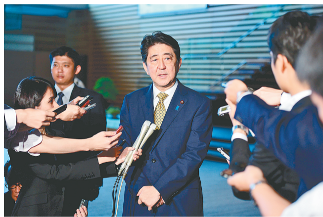
9月8日,日本首相、自民党总裁安倍晋三(中)在东京的首相官邸对媒体发言。

日本首相安倍晋三9月8日在没有任何竞争对手的情况下,连任执政党自由民主党总裁。如无意外,他将顺利进入下一个首相任期。那么问题来了,试图抛弃和平宪法、解禁集体自卫权的安倍今后3年将继续在所谓“积极和平主义”的危险道路上“暴走”,还是会微调政策方向、集中精力推行“安倍经济学”?