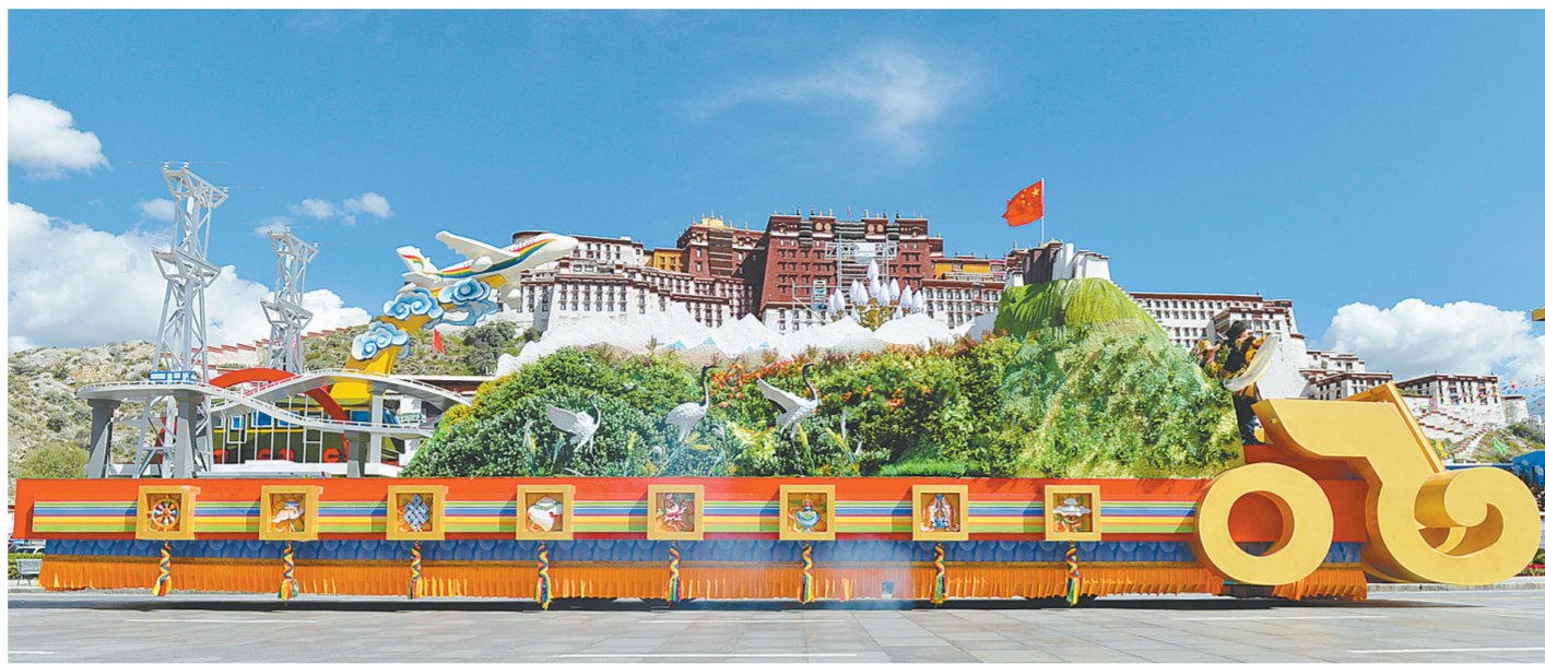
9月8日,西藏自治区成立50周年庆祝大会在拉萨布达拉宫广场隆重举行。这是游行的彩车通过布达拉宫广场。

(上接一版)主席台对面的布达拉宫广场上,彩旗飘扬,鼓乐喧天,身着节日盛装的各族群众早早从四面八方汇集到这里,手中挥动着国旗、彩旗,汇聚成一片欢乐的海洋。上午10时,西藏自治区党委副书记、自治区人民政府主席洛桑江村宣布大会开始。全场起立,奏唱国歌,鲜艳的五星红旗在布达拉宫广场冉冉升起,穿着民族服装的少先队员向在主席台上的中央代表团领导献上鲜花,表达西藏各族人民的诚挚敬意。