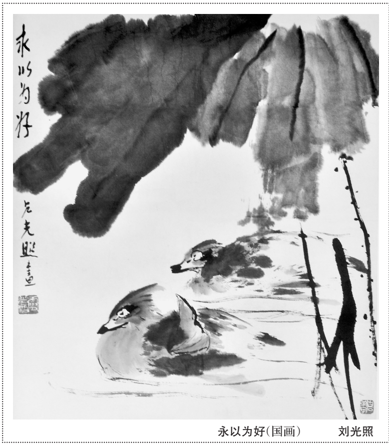
永以为好(国画) 刘光照

画面上一个一个小印模,已经很精彩了,它主题简单,就是百戏:两人比武,梳高高发髻,穿着宽宽裤脚,伸长长手臂,煞是好看。将小印模排列在汉砖画面上,真是视觉盛宴。这幅拓片没有边框,只在左侧面有云纹装饰,中间砖芯部分是乳丁纹,上边印的是这个图像,下边还是这个图像,上下两排一模一样。这不是汉画像砖构图的特例,同样的还有譬如西王母那幅,上下也是一个图像,就是西王母神人在神界的生活,她身边还有玉兔,三足乌,九尾狐,是汉人想象的神话世界,画面很单一,表达很多彩。相近的构图还有边框上下两排不一样的图像,譬如上排是狩猎的,下排是车马出行的。也有作为砖芯用的,譬如有一幅就是仙鹤拉车,中间两排,菱形图案做边框。还有上下两排图像,譬如一排是常青树,一排是孔子问童子的。这样的构图可以叫作主题构图法吗?好像不能。不能因为一个图像一个构图就说是一个主题。据悉郑州画像砖确实有主题构图的图像,那是一个院落,有高墙,有房屋,有奴婢,有主人;园中有树木,天空有飞鸟;门口有阙,阙外有人拜访。一块砖采用了多种方法凸出豪华庄园生活的主题、用多个相同的图像构图,能强调加深人的印象。一排排的车马奔腾,连接起来像是车马辘辘的征战,一对对的仙鹤拉车,看起来如入仙境。这种构图更突出显示的是图像在构图中的装饰美。因为装饰的美,征战、仙境的审美感觉就油然而生。这种构图应属装饰性构图。郑州汉画像砖中最常见的就是此类构图。