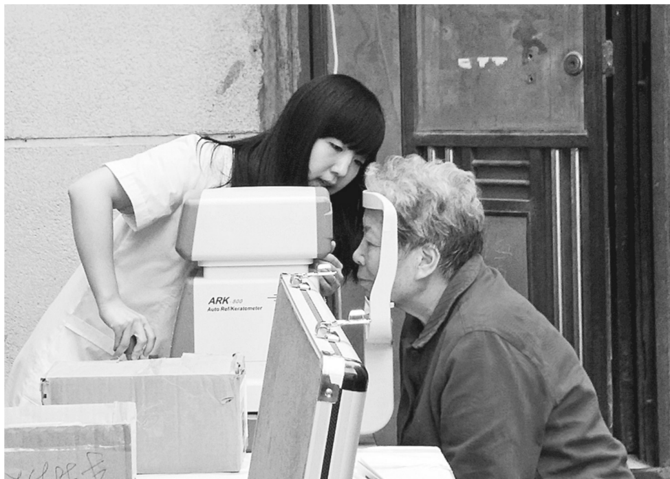
日前,东风路街道科技市场社区联合省康复研究院,邀请眼科专家免费为辖区群众检查眼疾或弱视,现场为大家发放新型助视器。

会等方面的先锋模范作用,推动社区工作又好又快发展。 活动中,以召开党员座谈会的形式,请党员各抒己见,献言献策。党员代表纷纷从建设社会主义新型社区的大局出发,从推进社区基层党风廉政建设、作风建设、加强党员干部的教育和规范化开展、促进当前各项工作的顺利开展出发,畅所欲言,提出意见和建议,为更好地服务群众奠定了基础。