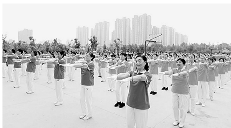
启动仪式上举行第三套有氧健身操集中展示。

本报讯(记者 孙志刚 通讯员 方亚瑞 文/图)日前,中原区科协、区教体局、区科技局、区工信委联合开展了以“万众创新,拥抱智慧生活”为主题的“中原区2015年全国科普日”启动仪式。 本届科普日活动,突出三个重点:一是创新引领新常态。重点宣传我国经济从高速增长转向中高速增长,进入新常态,大众创业、万众创新是中国新的发展动力。二是创新成就我梦想。通过广泛开展公众参与的创新科普