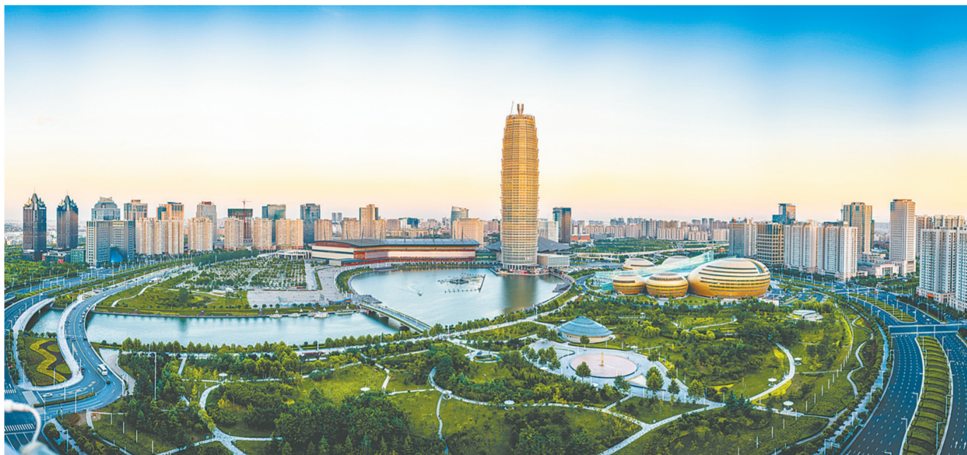
郑东新区CBD风景如画

公共财政预算收入是衡量一个地方经济发展的重要指标之一,郑东新区全面建设的过程,也是地方公共财政预算收入节节增长的过程。2003年,全区公共预算收入为5722万元;2005年突破亿元,达到2.18亿元;2009年,实现由个位数到两位数的转变,达到10.39亿元;仅仅一年之后,2010年再上新台阶,达到22.09亿元,实现翻番;到2014年底,公共预算收入达到68.22亿元。