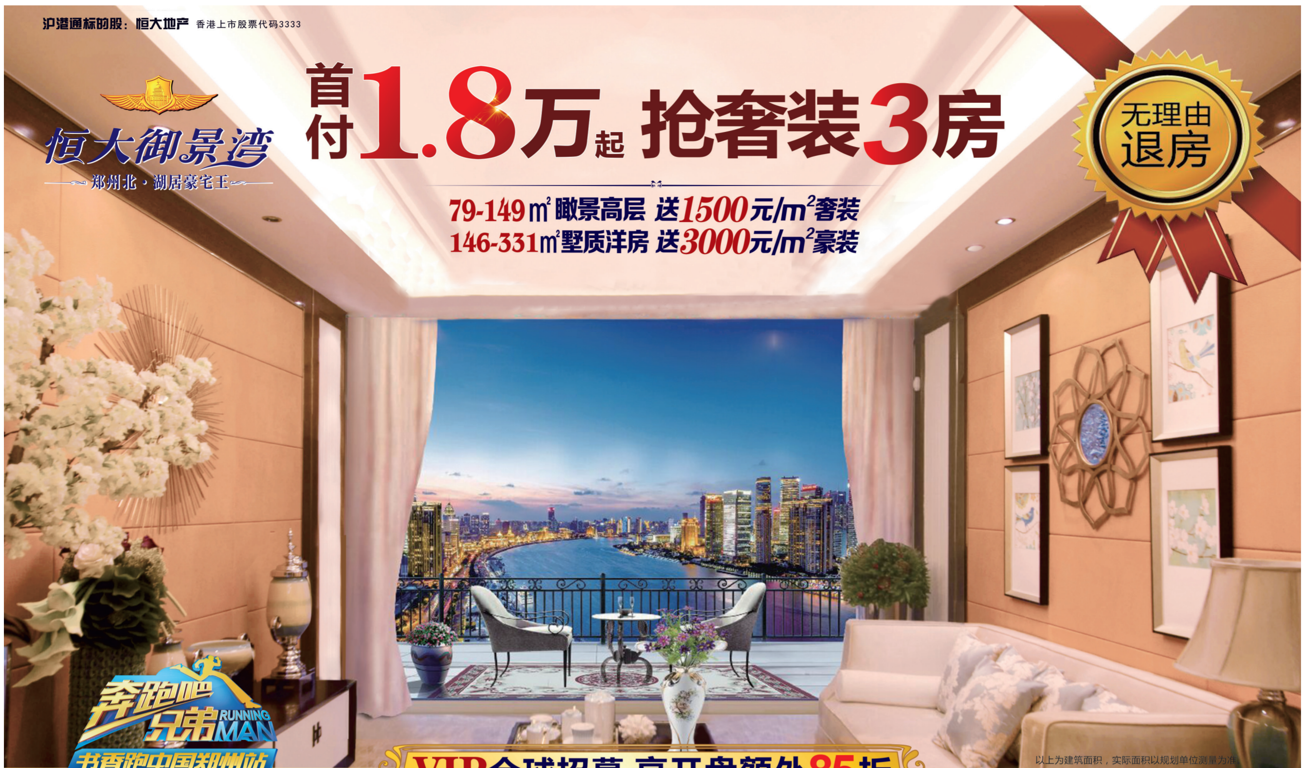
以上为建筑面积，实际面积以规划单位测量为准