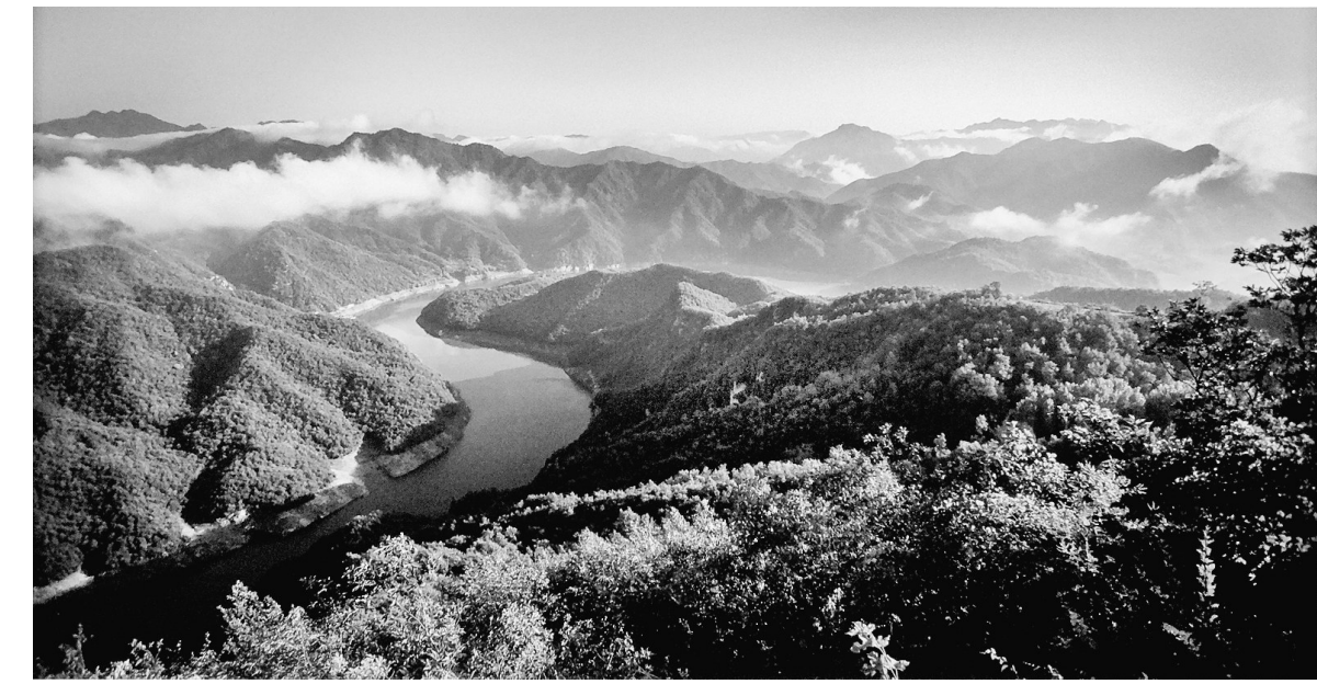
青山绿水

公元前262年，秦国出兵攻打韩国(战国时期韩国的国都位于今新郑一带)，重兵围困上党(今山西长治北部)。上党守将冯亭，派使者求救于赵国。使者对赵孝成王说：“我们韩国兵力有限，秦军又切断了我们与国内的关系，看来上党很快要失守了。但上党的官员、百姓，皆愿归赵，而不愿归秦。上党有城池十七座，你都可以接受。”赵孝成王大喜，立即召平阳君赵豹商议。他告诉赵豹：“冯亭有城邑十七座，我们可以接受吗？”赵说：“圣人最怕的是无由来之得利呀！”赵王解释：“这是本王的恩德所致，怎能说是平白无故索取呢！”赵豹辩解说：“秦国蚕食上党，使其不能与韩相通，