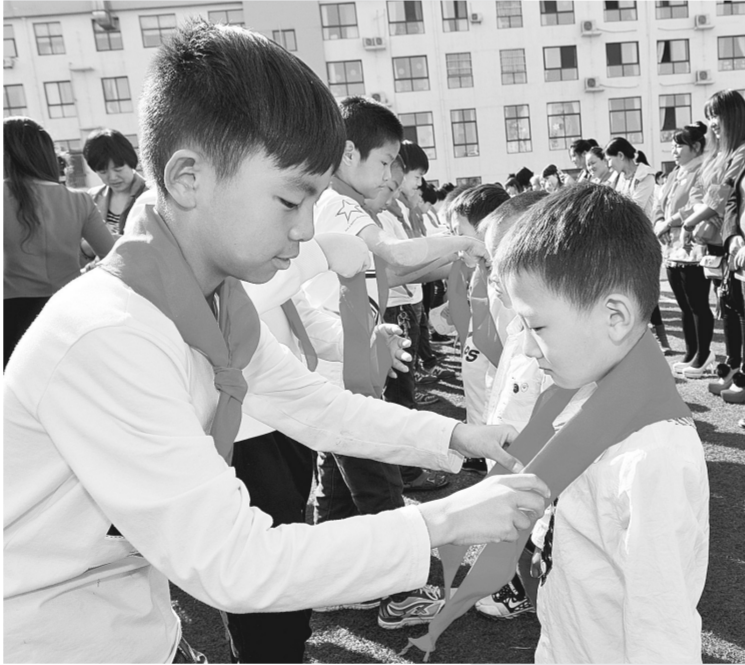
10月13日,是中国少年先锋队建队66周年的喜庆日子。为欢庆建队节,10月10日,郑东新区畅和街小学举行了“我是向上向善好队员”新队员入队仪式。