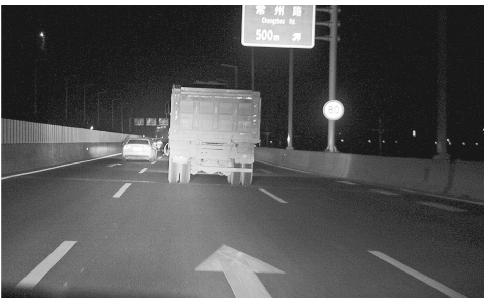
昨晚仍然有大货车在陇海高架上行駛