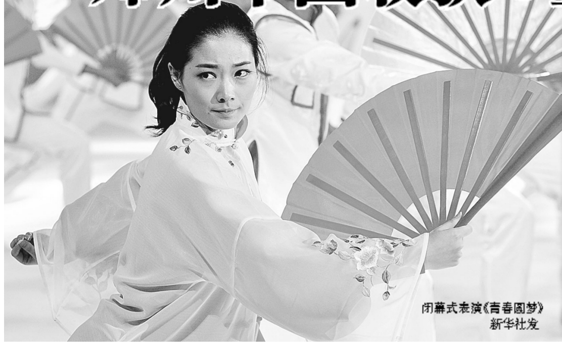
闭幕式表演《青春圆梦》

本报福州专电(记者 陈凯)昨天傍晚,伴随着一场《青春圆梦》精彩的文体表演,熊熊燃烧了9天的青运会圣火熄灭了。至此,第一届全国青年运动会在“榕城”福州幸福落幕。本届青运会,郑州市代表团发挥出色,共取得了6枚金牌、12枚银牌和15枚铜牌,共计33枚奖牌。郑州军团在创造优异成绩的同时,也取得了精神文明的大丰收——获得了本届青运会体育道德风尚奖。“双丰收”的郑州军团凯旋“榕城”,为中原父老交上了一份令人满意的答卷。