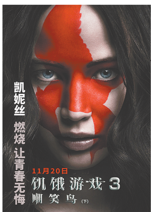
凯妮丝 燃烧让青春无悔