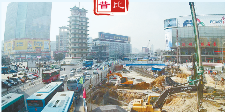
建设初期的二七广场站