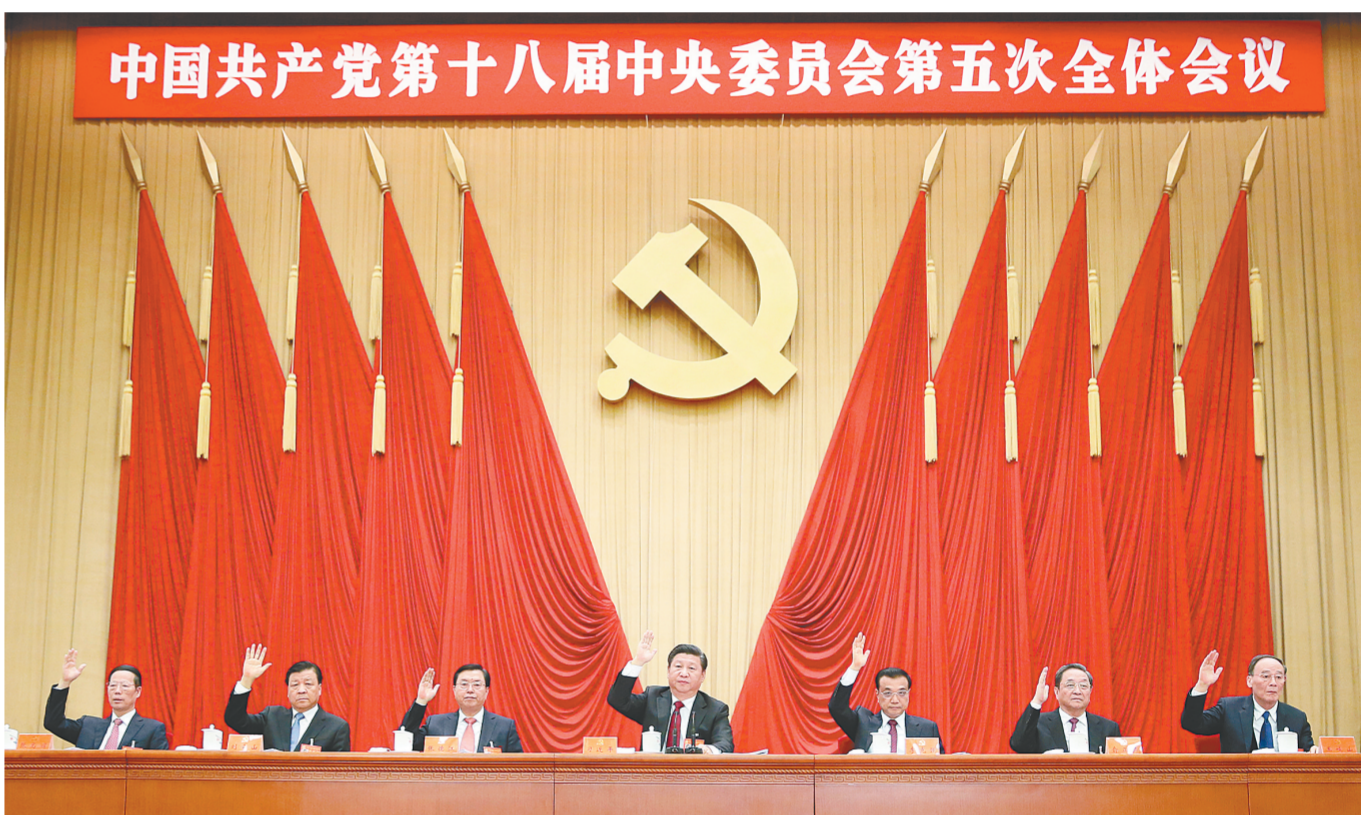
中国共产党第十八届中央委员会第五次全体会议,于2015年10月26日至29日在北京举行。这是习近平、李克强、张德江、俞正声、刘云山、王岐山、张高丽等在主席台上。