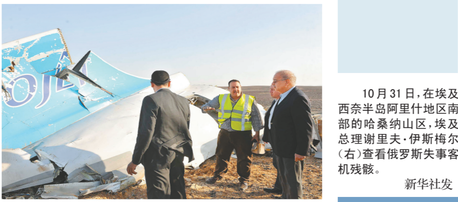
11月1日,人们来到俄罗斯圣彼得堡普尔科沃机场前献花,以悼念空难遇难者。