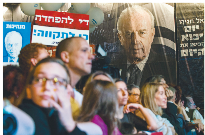
10月31日,在以色列特拉维夫的拉宾广场,人们参加集会纪念以色列前总理拉宾遇刺20周年。

新华社以色列特拉维夫10月31日电(记者 范小林)约10万名以色列民众10月31日晚在特拉维夫拉宾广场举行集会,纪念以色列前总理拉宾遇刺20周年。