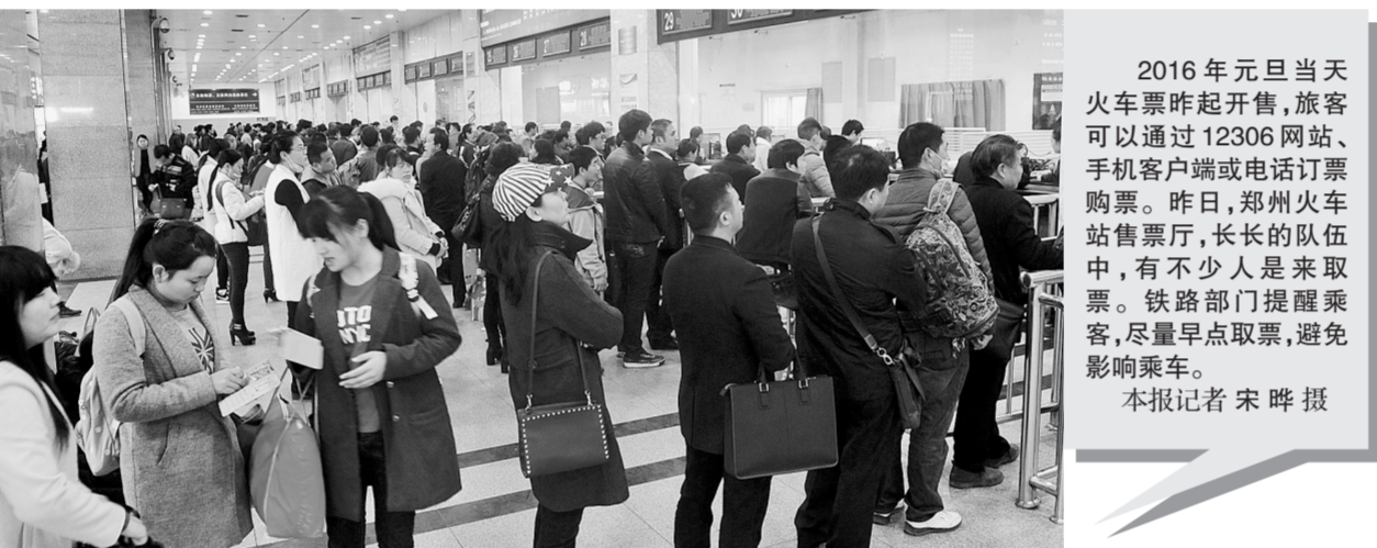
2016年元旦当天 火车票昨起开售,旅客可以通过12306网站、手机客户端或电话订票购票。昨日,郑州火车站售票厅,长长的队伍中,有不少人是来取票。铁路部门提醒乘客,尽量早点取票,避免影响乘车。