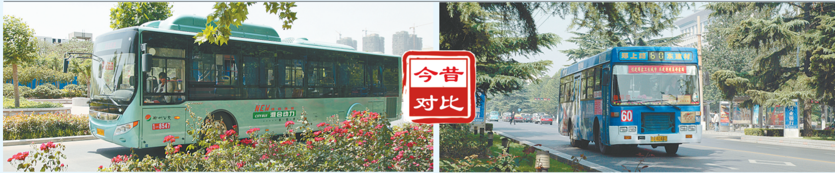
郑州街头行驶的新能源公交车