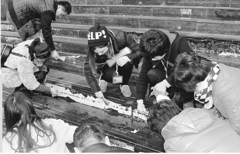
昨日上午,二七区一马路街道办事处120余名干部职工放弃周末休息时间,参加义务清理辖区小广告活动。此次清理活动以网格为单位,分头行动,以大道、敦睦路、钱塘路三条主干道为重点。经过半天努力,三条主干道小广告基本清除完毕。