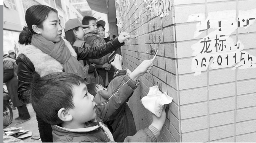
昨日上午,50余名青年网格志愿者,走进升龙商业广场,开展以“保护环境 从我做起”为主题的捡拾白色垃圾、清理小广告志愿服务活动。本报记者 李娜 文 丁友明 图