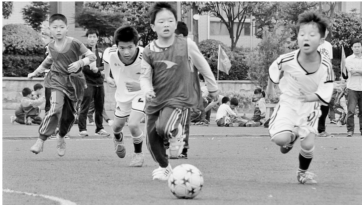
▲大力推进足球进校园工作 ▼在郑州可以看到现实版的“少林足球”

到2025年,体育产业总规模达200亿,全市人均体育场地面积2平方米,经常参加体育锻炼人口达400万人,占总人口比例40%以上……12月2日,郑州市政府出台了关于加快发展体育产业促进体育消费的实施意见(以下简称《意见》),对郑州市体育产业十年的发展规划提出了明确要求,为我市体育产业发展勾勒出一幅清晰恢宏的发展蓝图。