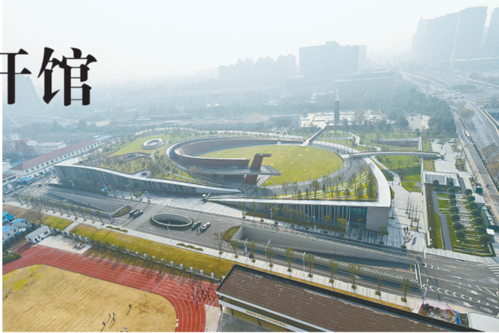
这是12月7日拍摄的侵华日军南京大屠杀遇难同胞纪念馆新馆全景。

12月13日，南京大屠杀死难者国家公祭仪式将在侵华日军南京大屠杀遇难同胞纪念馆内举行。12月14日起，新馆主题展将陆续面向公众进行预约参观。