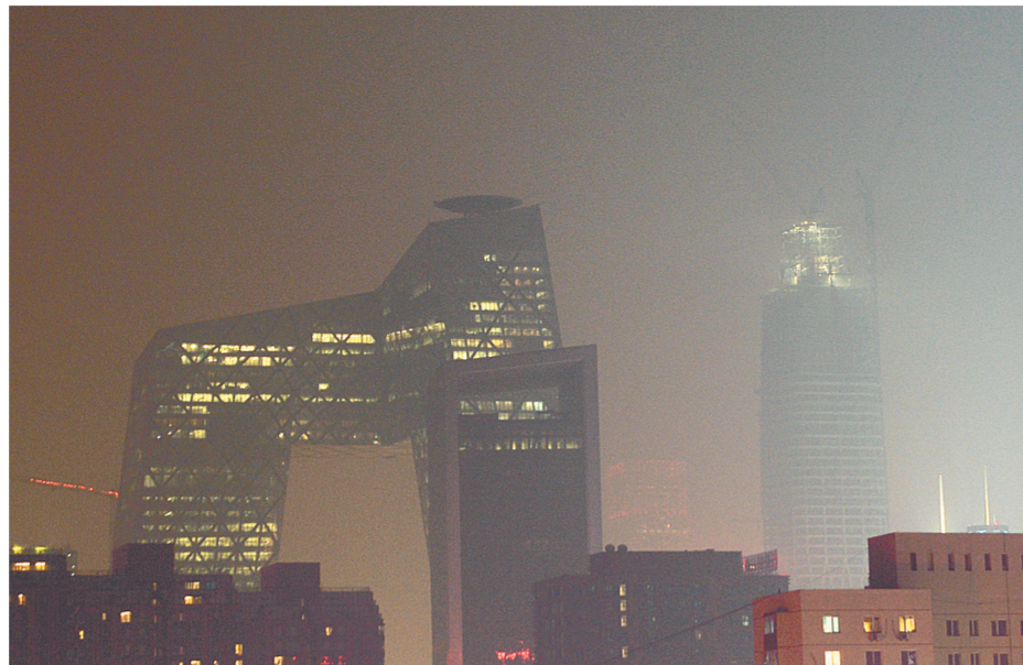
12月7日晚，笼罩在雾霾中的北京中央商务区。

河北省的石家庄、保定、衡水、廊坊等地也启动了应急响应，部分地区采取了比以往更加严格的措施，保定市从8日零时起在市区实施机动车单双号限行。邢台市7