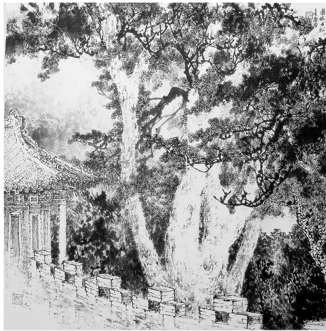
团城古松(国画) 白启哲