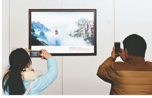
上合总理会场馆开放首日,大批市民来到郑州国际会展中心参观,场馆内人潮涌动。