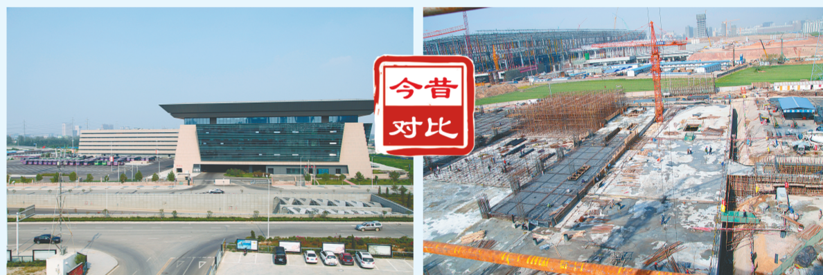
由郑州交通建设投资有限公司融资建设的郑州综合交通枢纽公路客运站建设前后对比图

未来5到10年,郑发集团将采取“缓退稳进,强实拓虚”的发展实施路径,逐步发展成为立足郑州、面向河南、辐射中原的经济效益和社会效益双优的国内一流现代化投资集团。