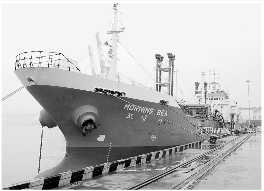
12月20日，青岛，韩国货轮“晨海号”正在卸载2600吨液体硫磺。这是中韩自贸协定正式生效后中国首票进口货物，享受零关税优惠。

中韩和中澳自贸协定20日正式生效。两个自贸区开放水平高、规模大，为中国同亚太国家签署双边和多边自贸协定提供了范例，也为构建亚太自贸区增添了新动力。 两个自贸区的建立对参与方而言是共赢之举，同时对亚太经济的推动作用明显。 中韩自贸协定正式生效，意味着经济总量高达12万亿美元的共同市场的形成。大韩贸易投资振兴公社中国事业团团长张炳松说，这一覆盖广泛领域的自贸协定将给蓬勃发展的韩中经贸关系装上新引擎，推动双方合作再上新台阶，也对东北亚乃至亚太地区自贸区发展产生深远影响。 据测算，中澳自贸协定生效三年内中国对澳出口的产品可获得16亿美元关税减免。澳大利亚大学东亚经济研究所所长德赖斯代尔认为，协定不仅将为双方带来好处，而且可以成为扩展亚太自贸区的第一个步骤。 中国已签署自贸协定14个，涉及22个国家和地区。中韩、中澳自贸区的建成将是构建亚太自贸区的重要一环。展望未来，随着中日韩自贸协定和《区域全面经济伙伴关系协定》等域内自贸安排取得进展，亚太自贸区进程将加速前行。 据新华社北京12月20日电