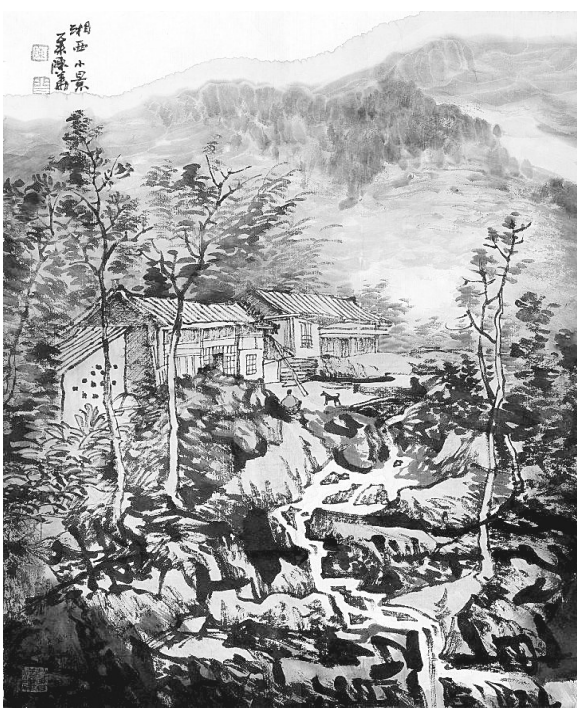
湘西小景 (国画) 陈华