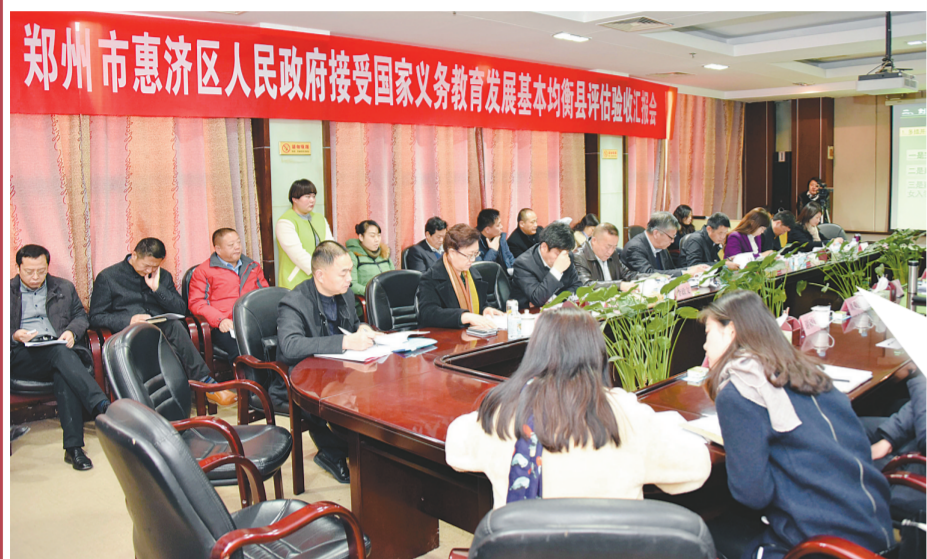
郑州市惠济区人民政府接受国家义务教育发展基本均衡县评估验收会议

2015年,惠济区教育局严格按照区委、区政府目标要求,创新思路,健全政策,加强管理,真抓实干,各项目标任务稳步推进,全区教育事业呈现出良好的发展态势,并荣获全国田径越野锦标赛1金1银、郑州市元旦长跑活动优秀组织奖、创建河南省全民健身示范城市工作先进单位、全国文明城市创建工作先进集体、郑州市教育系统家庭教育先进集体等近60项集体荣誉称号。