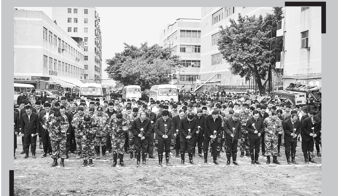
12月26日拍摄的哀悼仪式现场。

据新华社深圳12月26日电(记者赖雨晨 叶前 白瑜)26日,国务院深圳光明新区渣土受纳场“12·20”特别重大滑坡事故调查组全体会议在深圳召开。调查组组长、国家安全监管总局局长杨焕宁强调,要坚决贯彻落实习近平总书记、李克强总理等中央领导同志的重要批示指示精神,依法依规,实事求是,彻查事故原因,严肃追究责任,给全社会一个负责任的交代。