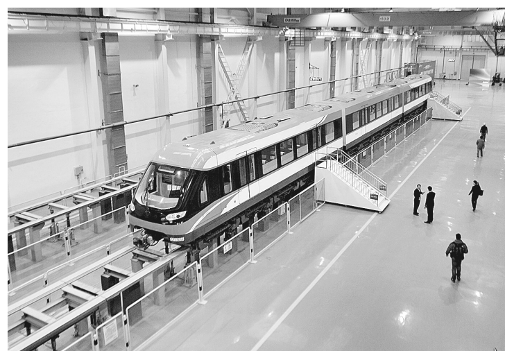
长沙磁浮车辆段综合基地等待试运行的磁浮列车(12月26日摄)。

据新华社北京12月26日电(樊曦 刘新红)记者从中国铁建股份有限公司了解到,26日,由中国铁建实施设计施工总承包的长沙中低速磁浮线开通试运行,这是我国首条投入运营的中低速磁浮线。