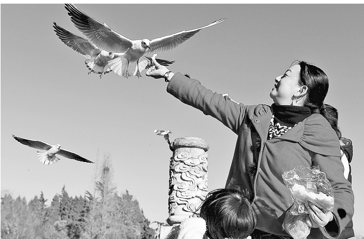
上图 1月3日,游人在云南昆明大观公园里给红嘴鸥喂食。新年伊始,云南省昆明市阳光明媚,气候宜人。人们来到市内各大公园休闲,尽享冬日暖阳。

作为太阳系八颗行星中最神秘的一颗,水星将在5月9日发生一次非常罕见的凌日现象。“水星凌日”是由于太阳、水星和地球排成一条直线而出现的现象,它发生的原理与日食相似。该天象平均100年只出现13次。但遗憾的是,这次水星凌日发生在我国的夜间,只有新疆极西部地区有机会欣赏到全过程。