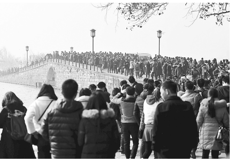
左图 1月1日,杭州西湖断桥附近游客众多。当日众多游客来到浙江杭州西湖风景名胜景区观光游览。