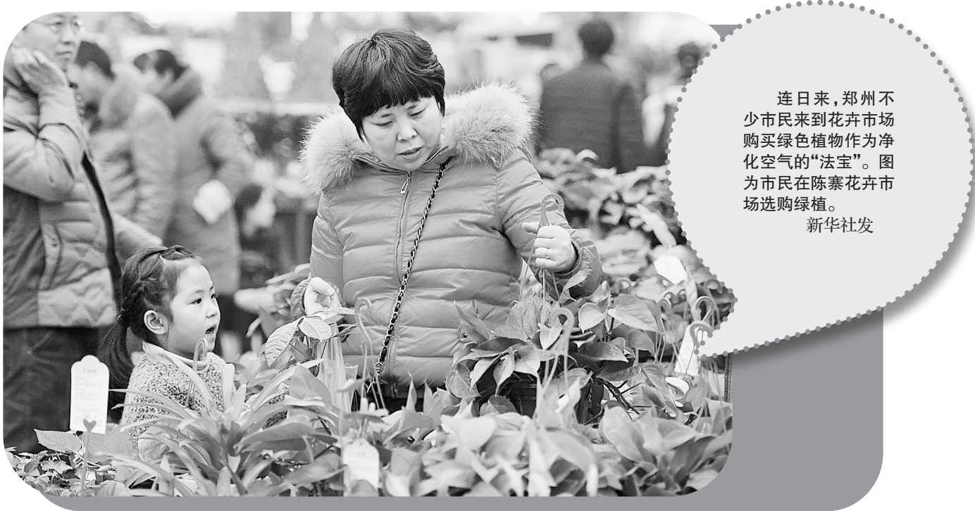
连日来,郑州不少市民来到花卉市场购买绿色植物作为净化空气的“法宝”。图为市民在陈寨花卉市场选购绿植。

票会在库内保留一段时间后再进入售票系统,每晚22点至23点间以及中午12点前后,是抢票成功率较高的时候。旅客若第一时间未买到票,不妨提前15天多上12306网站,及时刷新,把握“捡漏”机会。