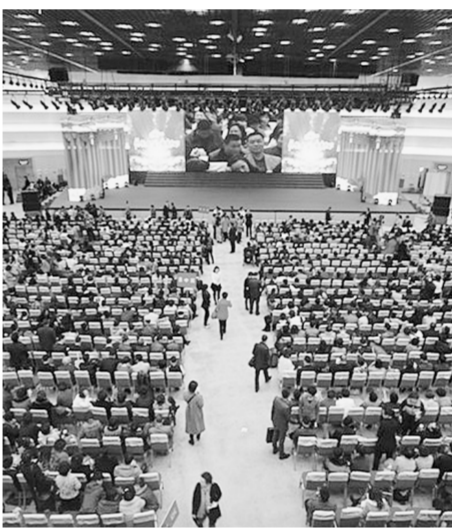
会展中心各种会议、会展接二连三

如意湖办事处从引商、安商、育商多角度为楼宇经济发展创造良好的环境。如以“如意前程”大型人才招聘会为平台,为辖区企业提供各类优秀人才,设立楼宇便民服务站,为企业员工提供便利服务。目前CBD区域员工餐厅达到39处,今年全年CBD区域新增楼宇配餐点76处,累计便民服务站和门店达到223处,可满足6.3万人的生活需求。此外,还出台《郑东新区中央商务区星级商务楼宇评定办法》,通过开展商务楼宇星级评定,吸引更多优质企业扎根东区。