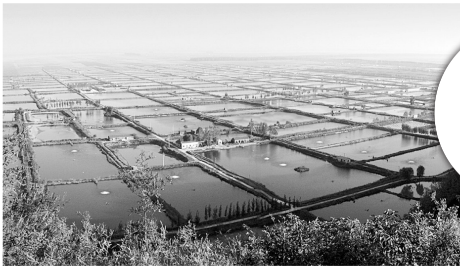
荥阳已成功创建全国首个现代渔业示范区