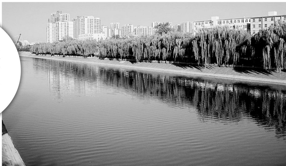
污水“全收集、全处理”,城区河道碧波荡漾