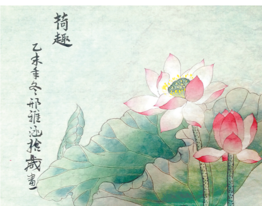
《荷趣》 郑东新区艺术小学 邢雅涵 辅导老师 刘洋歌