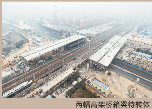
两幅高架桥箱梁转体