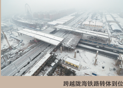
跨越陇海铁路转体到位

昨日上午,一项将载入郑州市政工程史的桥梁转体施工在该处顺利完成。两幅12300吨重的高架桥箱梁用时72分钟同步旋转87.3°,成功跨越陇海铁路,未来该处中州大道将由8车道扩容至20个车道。