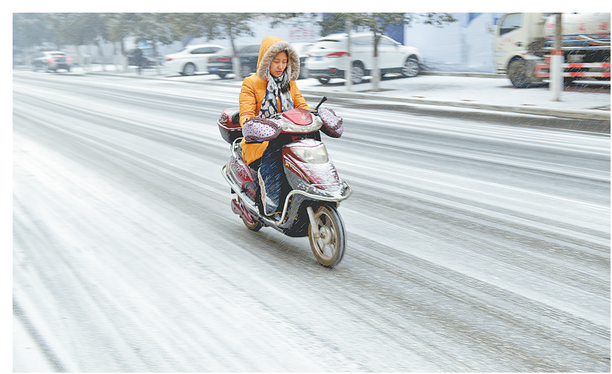
昨日,雪花降临我市,纷纷扬扬的雪花,为市区披上一层银。图为市民在雪中骑车穿行市区。

根据要求,各相关责任单位务必在今日12:00前彻底完成或冰雪的清理清运工作。市委督查室、市政府督查室将组织对全市清除冰雪情况进行督导检查考核。