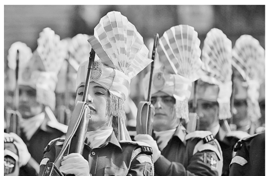
24日,在印控克什米尔地区首府斯利那加,印度女警参加阅兵式带妆彩排。印度将于26日在首都新德里举行盛大阅兵仪式,以庆祝第67个共和国日。