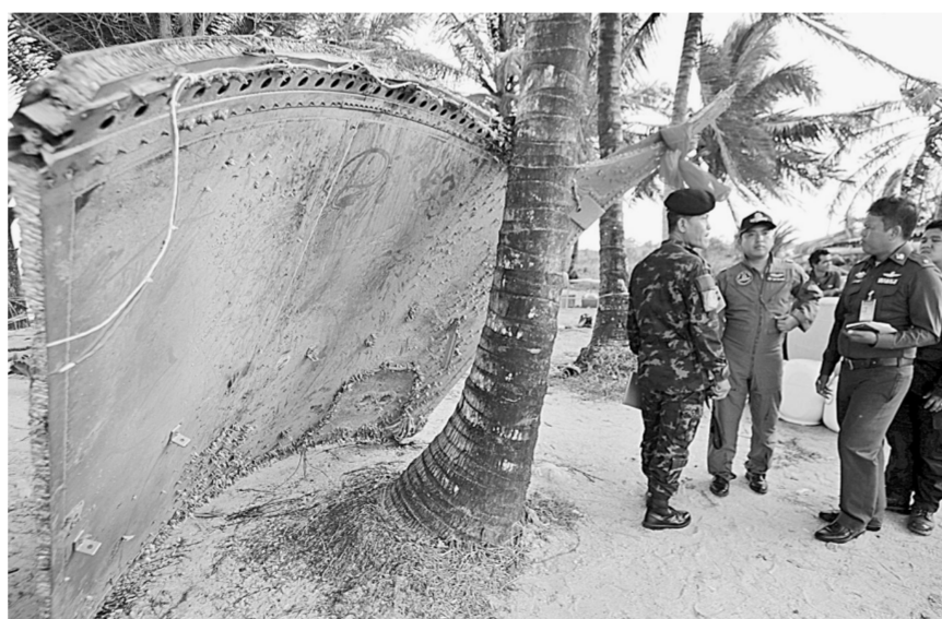
24日,在泰国那空是贪吗叻府海岸,泰国军方成员站在疑似飞机残骸旁。新华社吉隆坡1月24日电(记者赵博超 林昊)马来西亚交通部部长廖中莱24日表示,马方将就泰国南部海岸发现疑似飞机残骸一事向泰国当局进行确认,目前不能确定它来自马航370航班客机。 当地媒体援引廖中莱的话报道说,他已经指示马来西亚民航局就此事联系泰国国民航部门,希望公众不要传播未经证实的消息,以免给遇难者家属带来伤害。 泰国当地居民近日在该国南部沿海地区发现一块2米宽、3米长的疑似飞机残骸,引发人们对该残骸是否来自马航370航班客机的推测。据马新社报道,泰国当局将请航空专家来检验这块疑似残骸。 马来西亚交通部人士表示,对于马航370航班客机的搜寻工作,马方相信专家团给出的建议,即搜寻范围在南印度洋。目前,第一阶段对6万平方公里优先区域的搜寻工作已经完成,现在正在进行第二阶段的搜寻。 2014年3月8日,从马来西亚首都吉隆坡飞往北京的马航370航班客机在马来西亚与越南空域交界处与空中交通管制中心失去联系。这架客机载有227名乘客和12名机组人员,其中包括154名中国乘客。2015年1月29日,马来西亚民航局宣布马航370航班客机失事,并推定机上所有人员遇难。此后,包括中国在内的多国搜寻努力从未停歇。