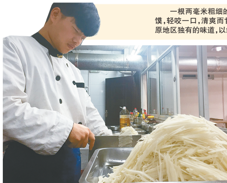
厨师在操作间制作芥丝

一根两毫米粗细的芥丝,晶莹剔透,光洁如玉,将之淋上香油,夹入馒头,或卷进烙馍,轻咬一口,清爽而甘烈的芥香迅速占据味蕾,充满口腔与鼻孔。千百年来,这种中原地区独有的味道,以细小香脆的芥丝为媒介,勾起了无数游子的乡愁。