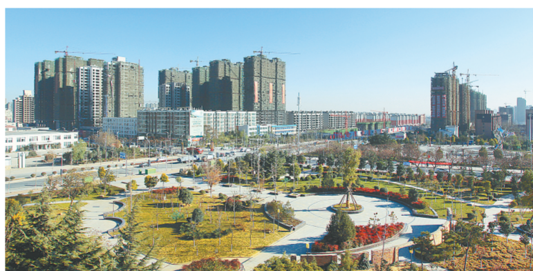
建设中的龙湖新城

在“两市镇”建设中,薛店新市镇将完成北环路、华山路等道路工程,并快速推进食品、医疗、商贸“三个超百亿”园区建设,以及完成“啤酒小镇”规划设计和招投标,建设啤酒商业风情街,着力打造以啤酒为主题,集生产、销售、观光为一体的