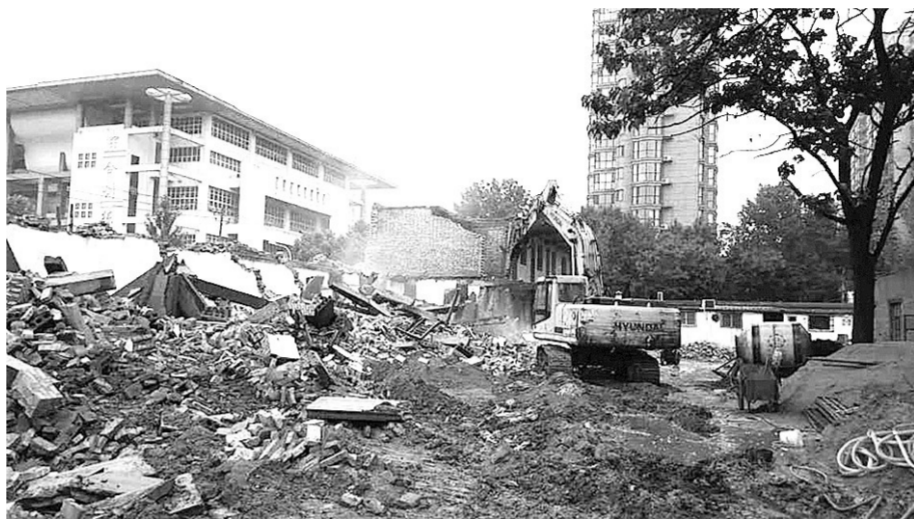
依法拆除违法建设