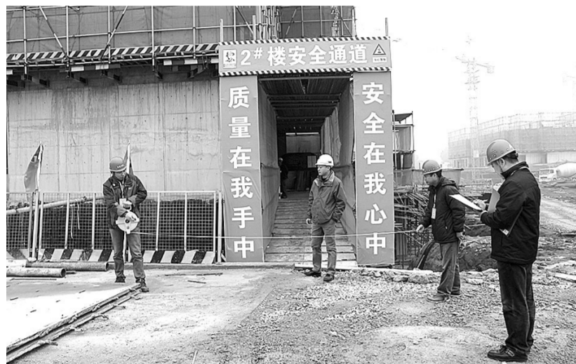
规划监察支队队员现场测量,进行违法建设的认定工作。

国无法不立,城市无规划则乱。维护规划的关键在于制止违规者。2016年1月1日起,新《郑州市城乡规划管理条例》开始施行。这是一部规范我市城乡规划管理的法律条例,在本市规划区内进行各项建设活动,必须遵守这个条例。尤其值得关注的是,新《郑州市城乡规划管理条例》对违法建设查处的工作程序、相关责任单位及任务等作了明确界定。以新《郑州市城乡规划管理条例》的施行为起点,我市违法建设查处工作将迈入一个新阶段,郑州城市未来也必将变得更加美丽、更加宜居。