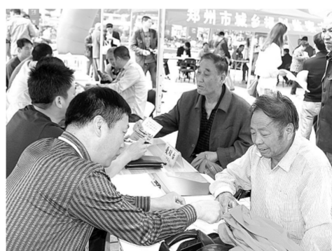
绿城广场《城乡规划法》宣传

伴随新条例的实施,今后,我市所有与违法建设查处相关的单位和部门都需要各自承担相应的法律责任。这将形成紧密协作的关系,合力守护郑州这座城市的的美丽和宜居。