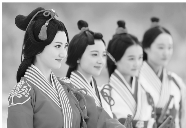
景甜饰演班淑(左一)与学堂的伙伴们

本报讯(记者秦华)由景甜主演的电视剧《班淑传奇》正在央视电视剧频道热播。久迹电视荧屏的景甜化身性格古灵精怪、敢爱敢恨的东汉“麻辣鲜师”班淑,点燃了春节期间电视荧屏的欢乐气氛。