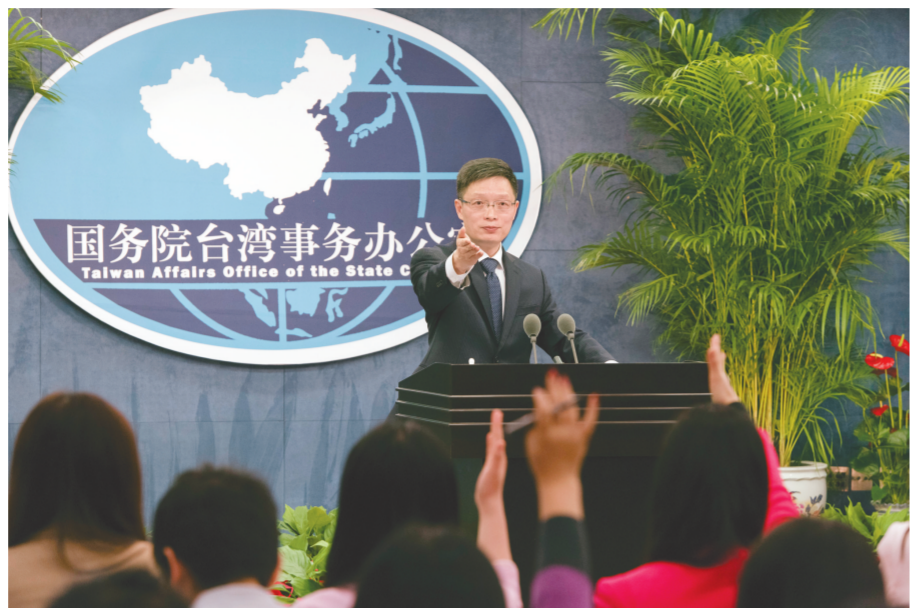
2月24日,国务院台湾事务办公室发言人安峰山在例行新闻发布会上邀请记者提问。

续谈判的态度,他说,在坚持“九二共识”的基础上,两岸商谈团队从2011年3月起就经贸协议已进行了12轮的业务沟通。至于下一步商谈事宜,目前双方正在沟通,近期会有结果。