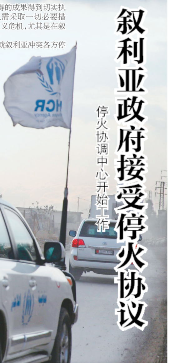
叙政府军不会停止对这些武装组织的军事打击。

按照停火协议成立的叙冲突各方停火协调中心在俄驻叙空军基地开始工作。俄罗斯国防部发言人科纳申科夫说,协调中心的主要任务是监督停火和推动和谈,叙反对派代表在决定停火并开始和谈之后,全天24小时都可向协调中心求助,协调中心将协助所有求助者与叙政府代表进行接触。