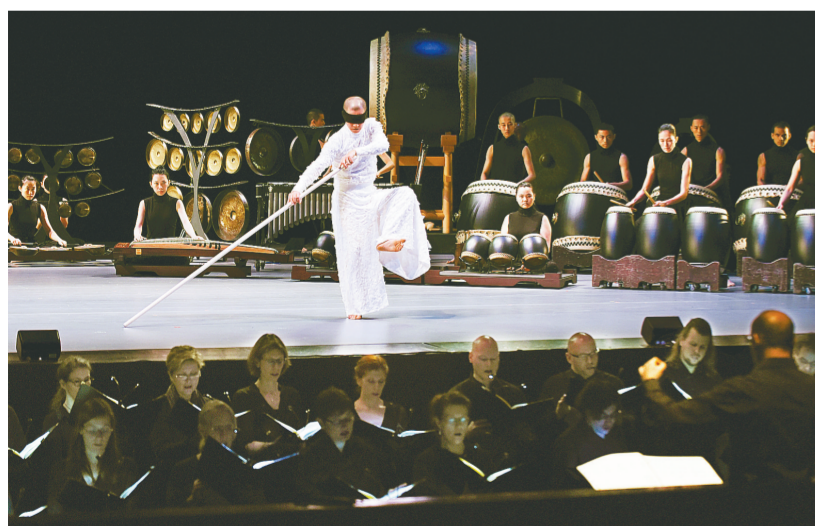
2月24日,优人神鼓演员与柏林广播电台合唱团一起演出《爱人》片段。当日,2016台湾国际艺术节开幕剧《爱人》在台北戏剧院举行彩排记者会。《爱人》由台湾艺术团优人神鼓与德国艺术家合作演出,以近百人的阵容演绎一场中国台湾相遇西方现代情诗的剧场作品。该剧将于2月25日至28日在台北戏剧院演出。