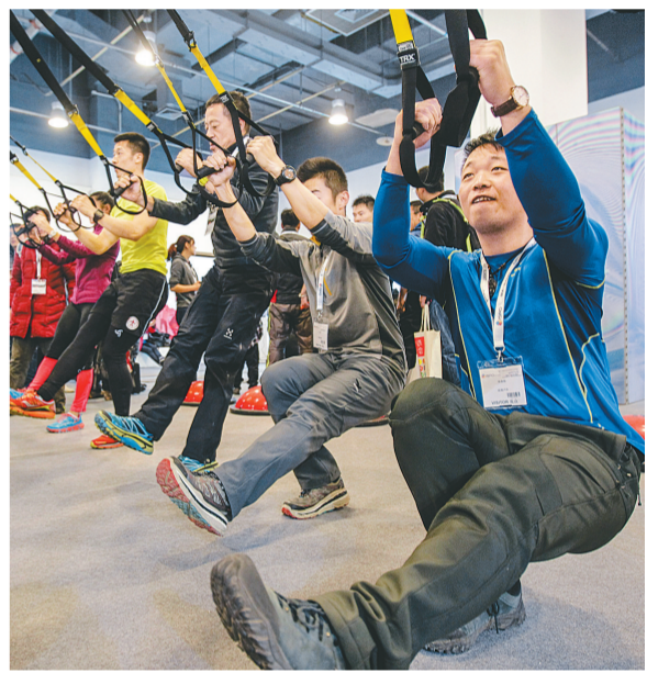
2月24日,参观者在体验全身抗阻力训练。当日,为期四天的第十二届亚洲运动用品与时尚展暨第八届中国国际山地和冬季运动机械博览会在北京国家会议中心开幕。此次展览吸引了490家展商,700多个参展品牌,展示来自冬季运动、户外运动、极限运动、运动时尚和功能性辅助面料等各个领域的最新产品和技术。

另外,有传言称建业的另一位中场主力尹鸿博有可能转会河北华夏,只是此消息还没得到官方确认,而一旦传闻成真,建业队去年的中场就只剩下了伊沃一人,重建将成为必然。