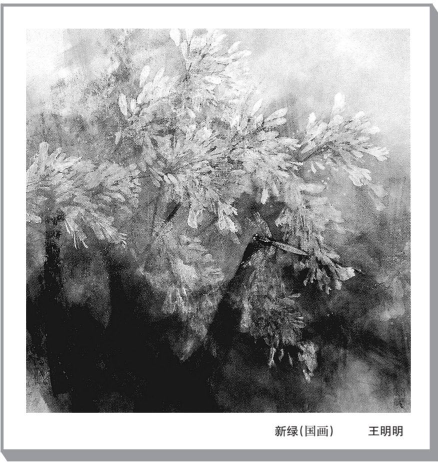
新绿 (国画) 王明明

“掌彩”这种独特的民间艺术，发源于农民，扎根于农村。歌词的内容多是歌颂、赞扬以及预祝和期盼的内容。千百年来，社会底层的劳动人民借此形式来寄托自己对生活对未来的美好祝愿。