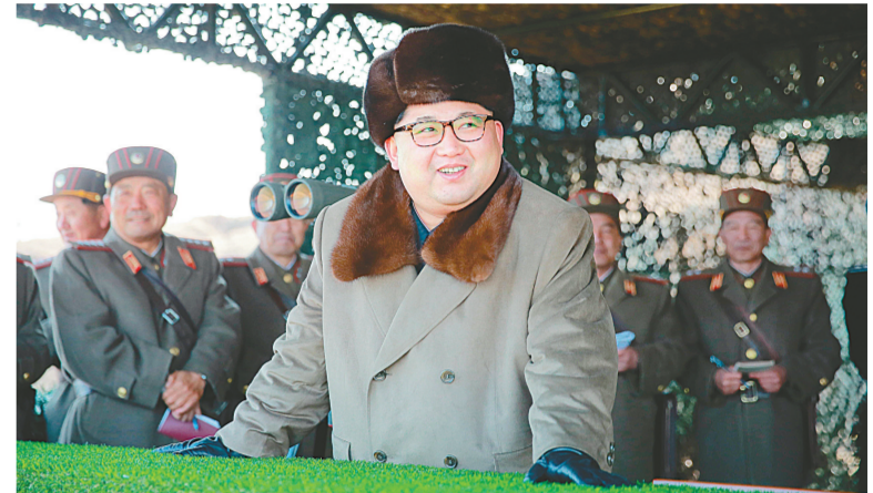
金正恩(前)指导朝鲜人民军进行登陆及反登陆防御演习。

新华社平壤3月20日电(记者郭一娜 陆睿)据朝中社20日报道,朝鲜最高领导人金正恩日前指导朝鲜人民军进行登陆及反登陆防御演习。