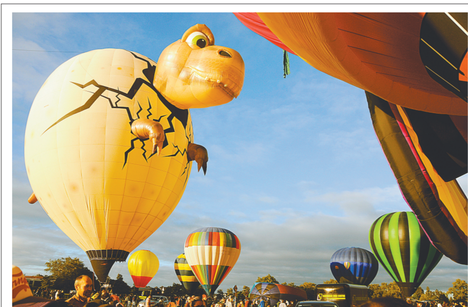
3月20日,在新西兰北岛的怀卡托地区汉密尔顿市举行的怀卡托国际热气球节闭幕式上,人们为“恐龙宝贝”热气球充气。当日,由于天气不佳,当天的谢幕升空表演未能如期举行,仅作地面展示。

为60%,而前者更喜爱简单生活,因此结婚率也相对低些,为55%。调查还显示,狗主人平均有60名网友,15名密友,猫主人平均有50名网友,密友数量为12个。英国《每日电讯报》援引宠特宝公司一名发言人的话报道:“研究显示出猫狗饲主在生活方式和人际关系上的区别。”调查结果显示,与猫奴相比,狗主人对宠物的爱更深。研究以10分为满分,让受访者就自己对宠物的感情打分,结果,狗主人平均打出9.5分,而铲屎官们平均打出8分。