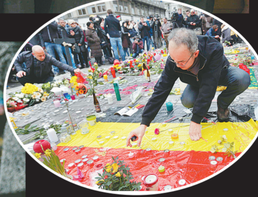
3月23日，在比利时布鲁塞尔，人们在悼念活动中摆放蜡烛。