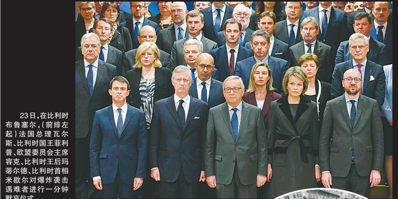
23日，在比利时布鲁塞尔，(前排左起)法国总理瓦尔斯、比利时国王菲利普、欧盟委员会主席容克、比利时王后玛蒂尔德、比利时首相米歇尔对爆炸袭击遇难者进行一分钟默哀仪式。