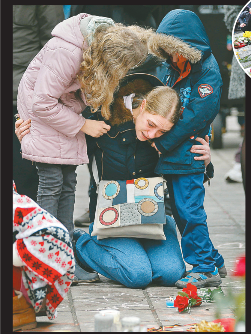
23日，在比利时布鲁塞尔举行的悼念活动上，一名女子安慰她的孩子们。