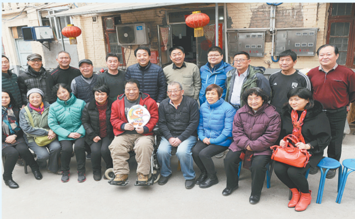
陇海大院爱心群体已成为郑州的一张名片