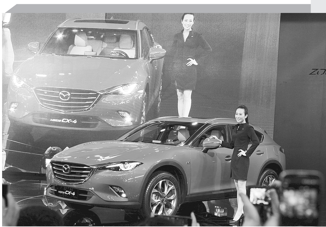
4月25日,2016(第十四届)北京国际车展会在京开幕。据悉,北京国际车展今年以“创新·变革”为主题,吸引了来自全球14个国家和地区的1600多家厂商参展。图为某品牌全新车型首次亮相。新华社记者 公磊 摄