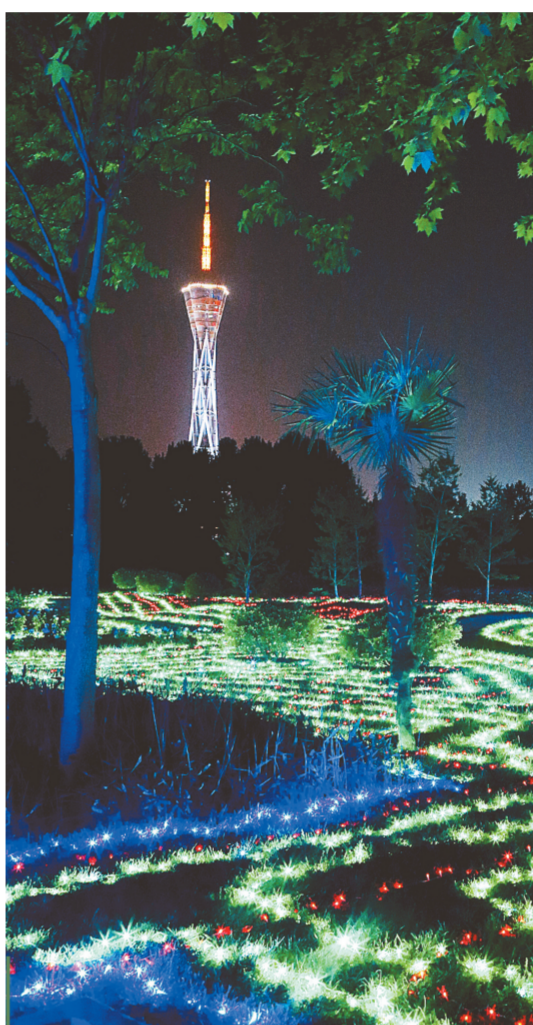
奇特神秘的“绿野仙踪”,充满异域风情的“荷兰风车”,色彩艳丽的“蘑菇伞”……“五一”小长假,众多市民走进郑州世纪欢乐园欣赏精彩的“奇幻之夜灯光秀”。为了让更多市民欣赏到这场精彩的视觉盛宴,该“灯光秀”将持续到“十一”长假。