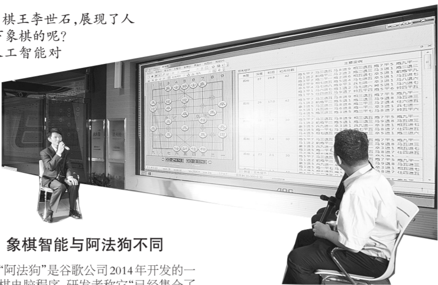
象棋智能与阿法狗不同

主办方说,这是一场机器对机器的比赛,为了避免人参与下棋,参赛两边还各设置监督员,参赛人员不得按照自己思维下棋。