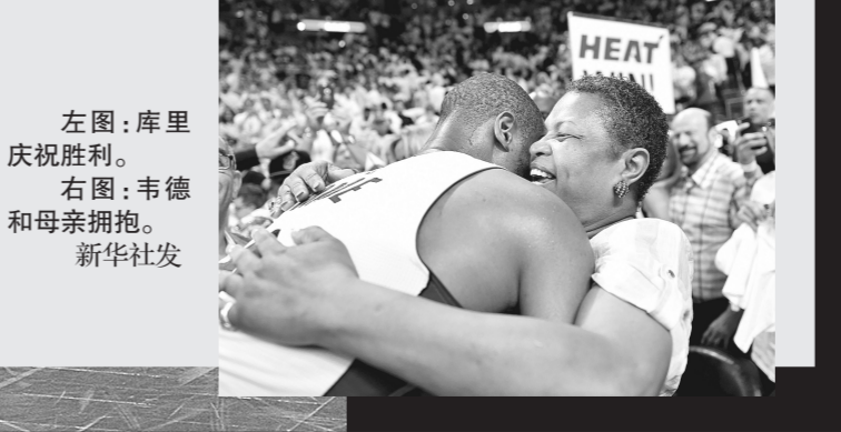
左图:库里庆祝胜利。 右图:韦德和母亲拥抱。

本场比赛,热火的韦德拿下30分,德拉季奇和约翰逊均有15分进账。猛龙队两名当家球员洛瑞和德罗赞发挥不佳,分别只贡献10分和9分。