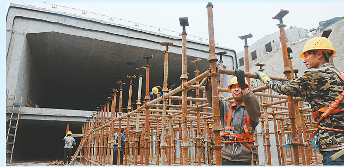
正在建设中的市民公共文化中心区地下管廊

为了逐步扩大工会爱心服务点的覆盖范围,今年全市各级工会组织将加速工会职工服务点建设,大力发动银行、医院、酒店、连锁超市、商户等爱心企业参与,年底前计划建成400个服务点。