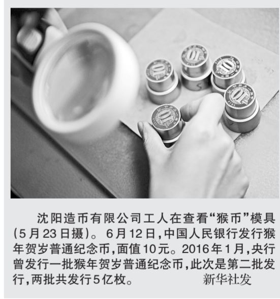
沈阳造币有限公司工人在查看“猴币”模具(5月23日摄)。6月12日,中国人民银行发行猴年贺岁普通纪念币,面值10元。2016年1月,央行曾发行一批猴年贺岁普通纪念币,此次是第二批发行,两批共发行5亿枚。