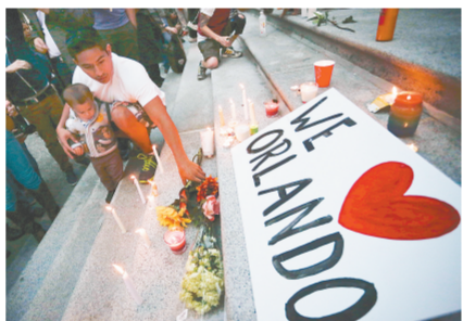
6月12日，在美国加利福尼亚州旧金山，人们在守夜活动上手持蜡烛悼念奥兰多枪击案遇难者。